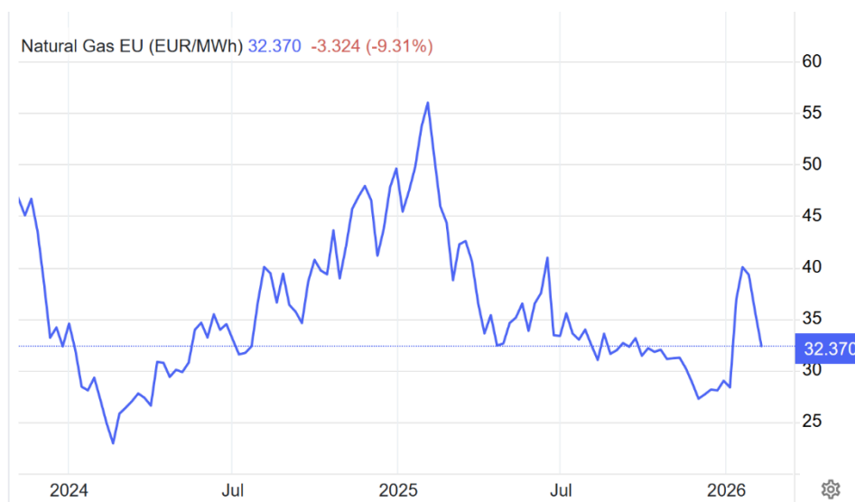
Figura SEQ Figură \* ARABIC 1: evoluția prețului gazelor la bursa TTF

Riscul de fluctuație al prețurilor poate fi redus prin diversificare: „nu se pun toate ouăle într-un coș”. Altfel spus, este foarte riscant de a procura tot volumul de gaze într-o singură zi, fiindcă nu se știe care va fi prețul în următoarele zile sau luni.