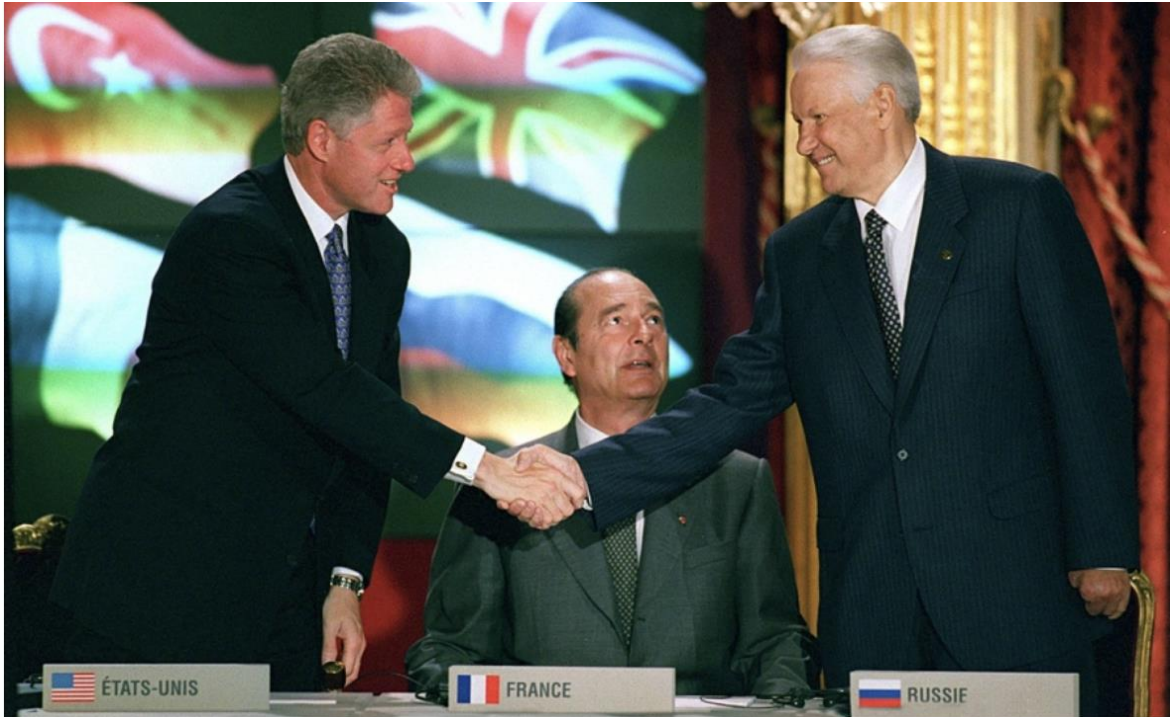
Președintele rus Boris Elțin, președintele american Bill Clinton, președintele francez Jacques Chirac în timpul ceremoniei de semnare a Actului de fondare Rusia- NATO la Palatul Elysee, 1997.

Întorcându-ne la momentul anilor 2000, V. Putin iată că încă mai spera că Rusia va fi acceptată ca un membru cu drepturi depline în „clubul Aliaților”. Timpul a trecut. Insași satisfacția lui Putin față de reticența Aliaților de a recunoaște Rusia un partener egal și de a o invita să adere la NATO a crescut, alegând să transforme Rusia dintr-un partener într-un huligan.