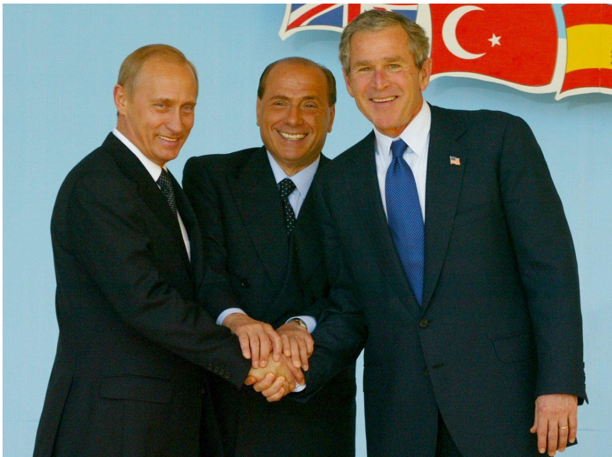
Summitul NATO 2002. Vladimir Putin cu premierul italian Silvio Berlusconi și președintele american George Bush.

În 2022, Vladimir Putin a spus clar ceea ce Kremlinul niciodată nu a vrut să admită: Rusia a dorit să adere la NATO, dar a fost refuzată. Se întâmpla în 2000 chiar înainte ca V. Putin să preia mandatul său de președinte „pe viață”. Acesta spune cu entuziasm cum aliații NATO au rămas stupefiați de propunerea lui V. Putin de a adera la NATO. În opinia liderului rus, cu această ocazie occidentul și-a arătat ipocrizia în relație cu Rusia, cu partenerii și cu valorile pe care le promovează. Sunt însă mult mai multe aspecte pe care V. Putin refuză intenționat să le pomenească.