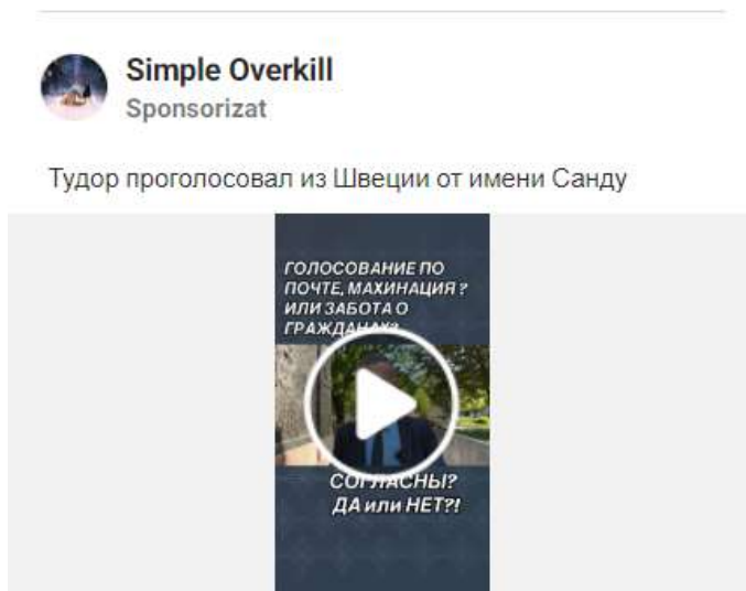
Fig. 3 - Pagina sponsorizează un video cu Tudor Șoilița care vrea să demonstreze că „cei din diasporă pot vota masiv pentru PAS” și că nimeni nu verifică acest proces. Potrivit autorului, buletinele de vot „pot fi scoase la un printer simplu, fapt ce va permite fraudarea alegerilor în favoarea PAS”.