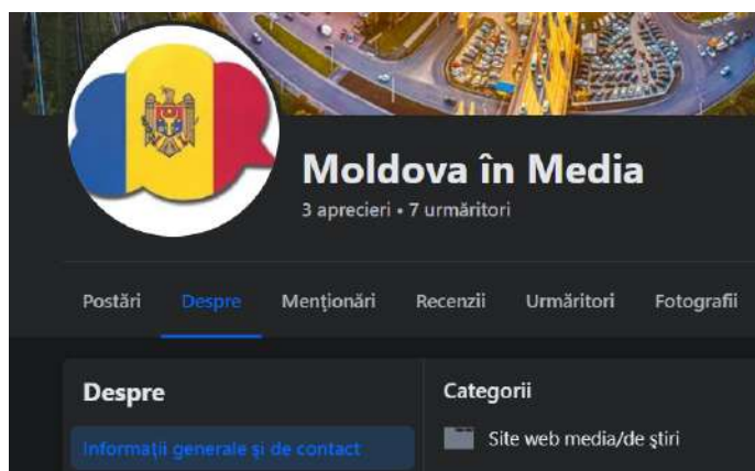
Fig. 1 - Pagina „Moldova în Media” utilizează ca imagine de profil steagul Republicii Moldova, iar la categorie notează că este „Site web media/de știri”.

Restul paginilor folosesc o identitate de branding similară: au fotografii de profil cu drapelul Moldovei și nume de utilizator care fac aluzie fie la organizații media, fie la organizații patriotice: „ Moldova cu Viață Plus ”, „ Moldova Cu Speranțe Mărite ”, „ Conștiința Îmbunătățită a Moldovei ”, „ Moldova în Media ”, „ Transformarea Moldovei Înainte ” și „ Știri din Moldova ”. Toate aceste pagini utilizează categoriile „ Site web media/de știri ”, „ Ziar ” sau „ Companie de producție media și difuzare ” pentru a crea iluzia că aparțin unor instituții media legitime.