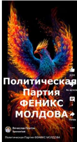
Fig. 6 - Reclamă ce sponsorizează Partidul Fenix, inițiat de Platon, care nu apare în biblioteca Google Ads Transparency. Notă: La moment cheltuielile legate de promovarea online nu sunt reflectate în rapoartele financiare ale partidului.

În cazul concubinei sale, Natalia Morari, pe Google Ads Transparency au fost identificate 17 reclame , însă ca și în cazul lui Platon nu apare suma cheltuită pentru promovarea acestor reclame.