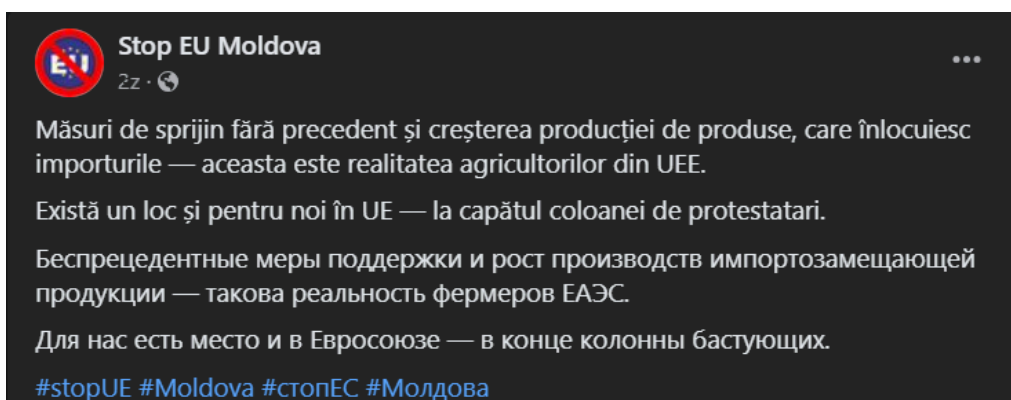
Fig. 8 - Postare în care se scrie că în UEE fermierii din Moldova vor avea de câștigat, în timp ce în UE vor sta la capătul coloanei de protestatari, insinuând că nu vor avea ajutor din partea Bruxelles-ului.

Atât Șor, cât și Platon (prin intermediul concubinei Morari) numesc referendumul drept o schemă de fraudare a alegerilor prezidențiale de către Maia Sandu. Totodată, Șor a început deja să promoveze activ Uniunea Economică Euroasiatică drept singura cale de salvare a Republicii Moldova.